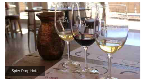
Spier Dorp Hotel