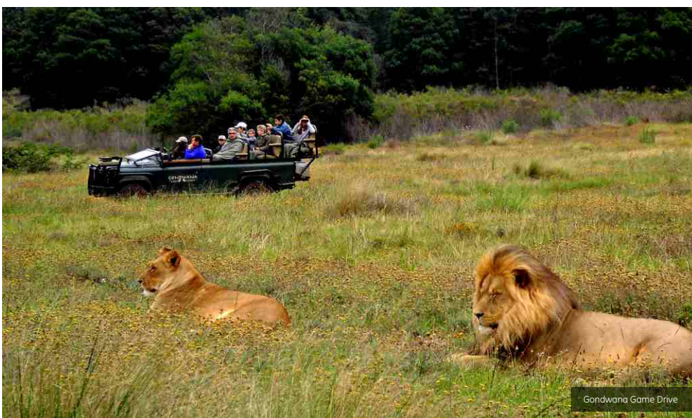
Gondwana Game Drive