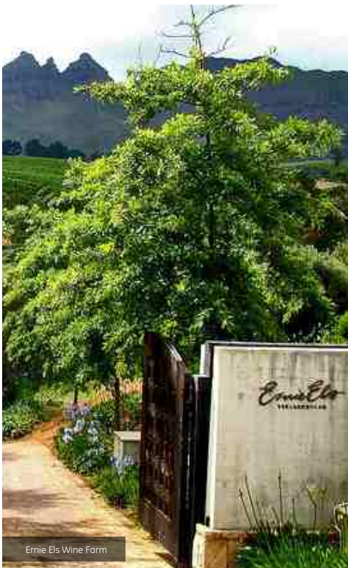
Ernie Els Wine Farm